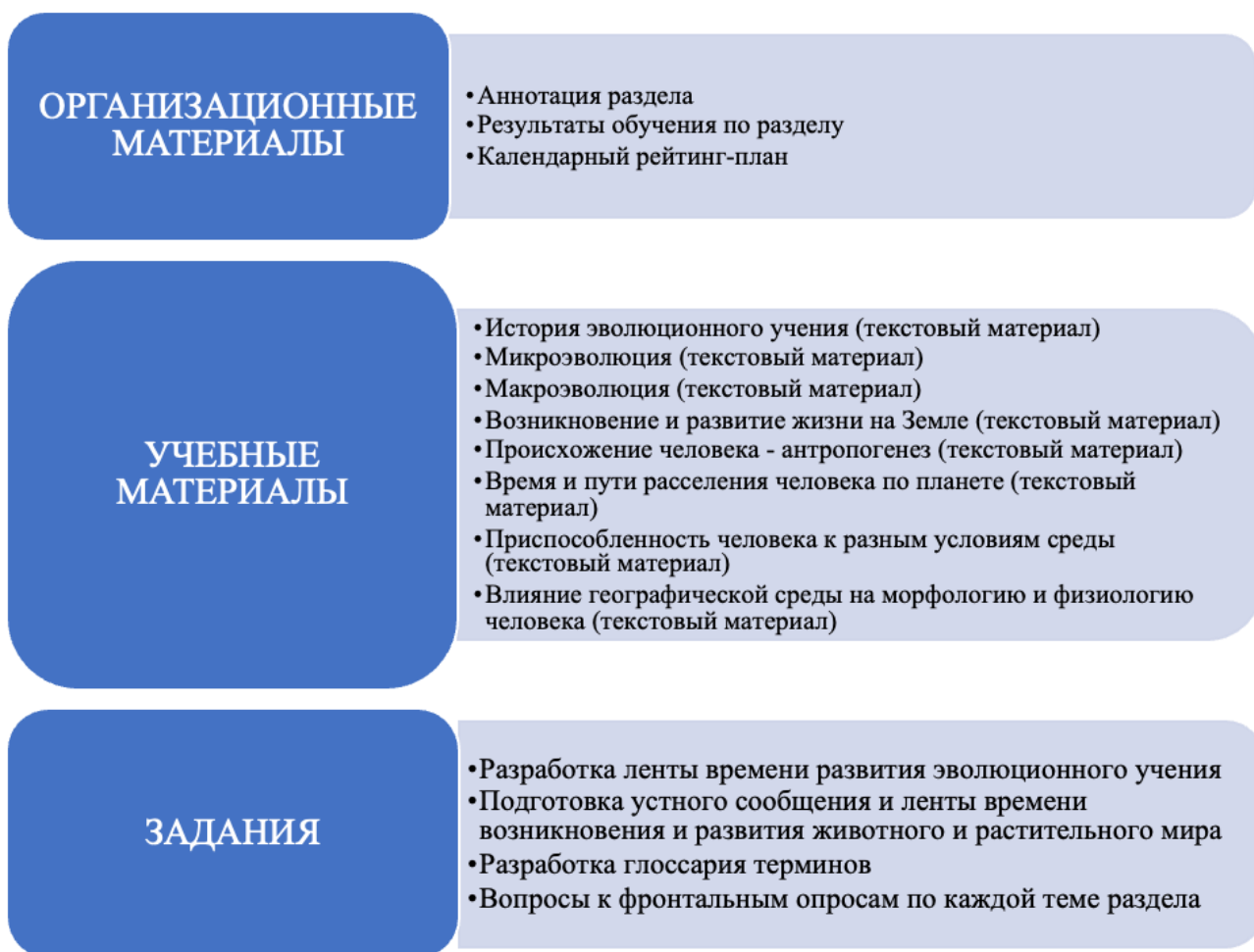
Рис. 1. Фрагмент структуры электронного курса по разделу “Теория эволюции”

Необходимость размещения результатов самостоятельной работы в электронном курсе делает ее выполнение обязательным для обучающихся, что дисциплинирует и повышает ответственность обучающихся. Ключевым механизмом стимулирования самостоятельной работы обучающихся является балльно-рейтинговая система, учитывающая результаты выполнения обучающимися заданий в электронном курсе в итоговой оценке за дисциплину.