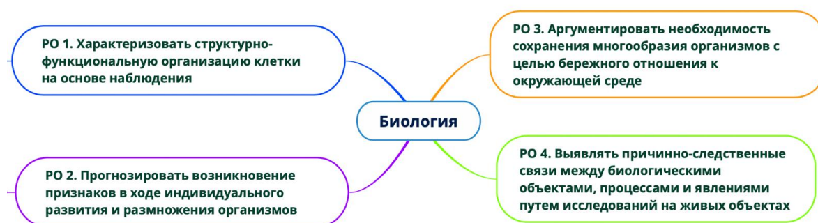
Рис. 1. Ключевые результаты обучения по дисциплине Биология

С учетом вышесказанного на рис. 1 представлены ключевые результаты обучения по дисциплине Биология, сформулированные на основе анализа требований ФГОС СПО и ФГОС СОО в соответствии с концепцией «микро-, макро- и мегамир», направленных на изучение разных уровней организации живой материи.