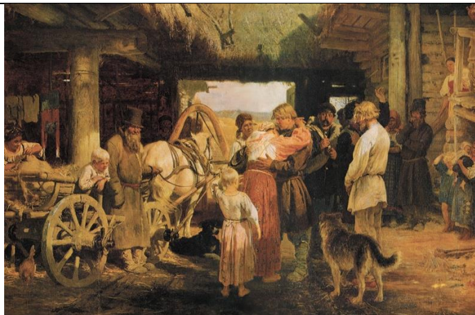
Проводы новобранца, И.Е. Репин

Какие эмоции показаны на картине И.Е. Репина, как это связано с текстом указа? Объясните, почему историки упоминают о том, что рекрутов провожали на службу как «в последний путь».